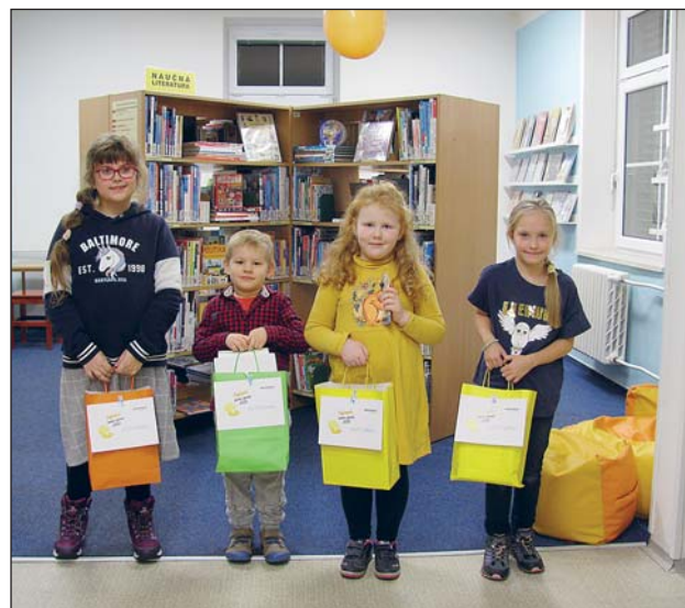
VYHLÁŠENÍ SOUTĚŽE Lovci perel v pobočce Daliborova.

Chcete-li získat aktuální informace, sledujte webové stránky jednotlivých poboček Knihovny města Ostravy.